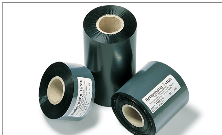
Taśmy barwiące do druku na koszulkach termokurczliwych.

Taśmy barwiące do druku na koszulkach termokurczliwych zostały zaprojektowane tak, aby zapewnić maksymalną czytelność i trwałość druku. Materiał jest gotowy do użycia natychmiast po wydruku, bez dodatkowych operacji utrwalania oznaczenia.