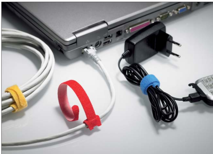
Opaski TEXTIE® można przymocować do przewodu co zapobiega ich zgubieniu.

Nadają się idealnie do montażu czasowego np. do instalacji teatralnych i estradowych lub do prototypów wiązek elektrycznych.