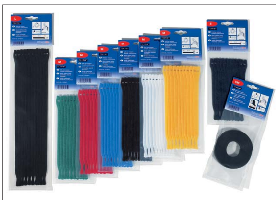
Opaski TEXTIE® są dostępne w różnych rozmiarach i kolorach.