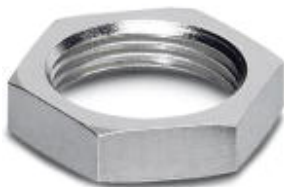
nakrętka płaska z gwintem M8

Należy pamiętać, że podane dane pochodzą z katalogu online. Proszę o pobranie kompletnych informacji i danych z dokumentacji użytkownika. Obowiązują ogólne warunki użytkowania dla materiałów pobieranych przez Internet. ( http://phoenixcontact.pl/download )