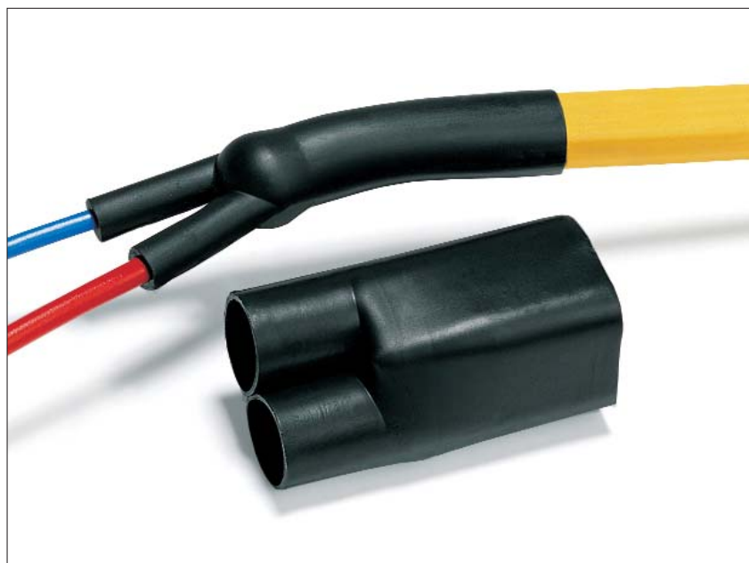
Palczatka termokurczliwa HEV przeznaczona dla kabla dwużyłowego.

Termokurczliwe palczatki HEV są przeznaczone do zabezpieczenia rozgałęzień kabli 2, 3 i 4 żyłowych przed uszkodzeniami mechanicznymi i dostępem wilgoci pracujących zarówno wewnątrz, na zewnątrz, jak i w ziemi.